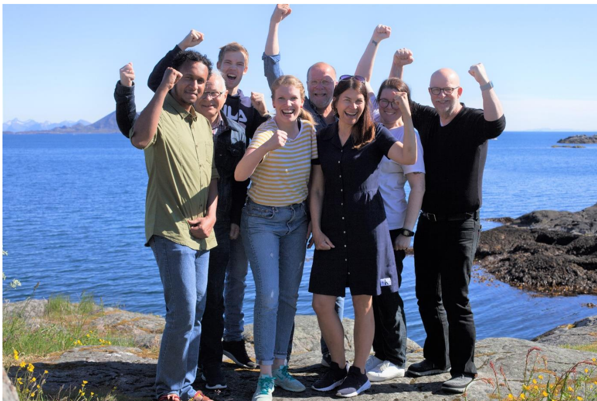
Vågan SV kjemper for en grønnere og rausere kommune!

På Stortinget har SV foreslått betydelig mer til kommunene. Lokaldemokrati bør handle om å utvikle samfunn og møte menneskers behov – og må ikke reduseres til hvor kronene kan kuttes. Samtidig er det avgjørende hvordan ressursene som faktisk finnes fordeles lokalt. Fellesskap og velferd er under angrep. Det skjer gjennom privatisering, sentralisering og manglende tillit til de som jobber i velferdens yrker. Hvem som har makt i lokalsamfunnet virker direkte inn på folks arbeidsliv, velferd og hverdag. Arbeidsforhold, tillit og kvalitet i tjenestene henger tett sammen. SV fremmer motsvaret til regjeringens politikk. Lokalt kan vi vise en annen vei og skape gode samfunn for de mange – ikke bare for de få.