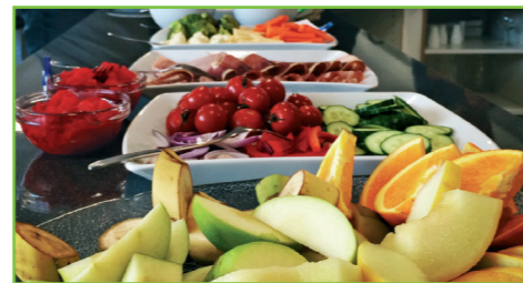
Dønna SV vil utvide tilbudet med kantine til å gjelde alle barn.