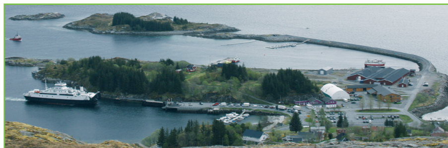
Dønna SV vil arbeide for å sikre gode ferje- og båttilbud til både Dønna, Løkta og Vandve med økt frekvens og åpningstid.